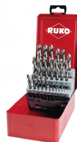
40677 Set spiraalboren DIN 338 type N HSS-G (25-delig)