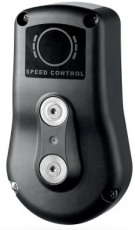
567000094 Speedcontrol - (430/020)