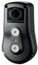
567000094 Speedcontrol - (430/020)