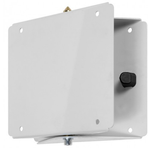
567000118 GELAKTE STALEN ZWENKBEUGEL SERIE 540 - (540/05)