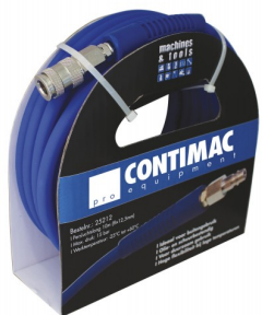
25212 Perslucht slang in composiet 10m