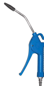
28611 Doseerbaar blaaspistool met silencer