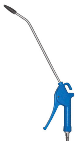
28744 Doseerbaar blaaspistool met lange bek 500mm