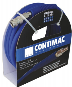
25212 Perslucht slang in composiet 10m