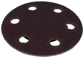
6158135380 HARS GEBONDEN PAD 120 GRIT 2"TR (50ST) VOOR RC7601