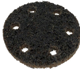
6158135390 NON-WOVEN ONDERLEGGER GROF 2" TR (50ST) VOOR RC7601