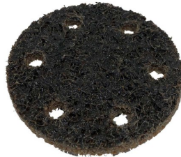
6158135390 NON-WOVEN ONDERLEGGERS GROF 2" TR (50 ST) VOOR RC7601