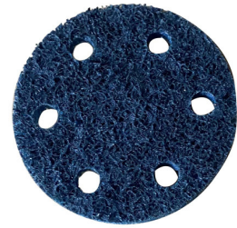
6158135370 HARS GEBONDEN PAD 80 GRIT 2" TR (50 ST) VOOR RC7601