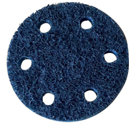
6158135370 HARSGEBONDEN PAD 80 GRIT 2" TR (50ST) VOOR RC7601