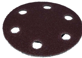
6158135360 HARS GEBONDEN PAD 60 GRIT 2" TR (50 ST) VOOR RC7601