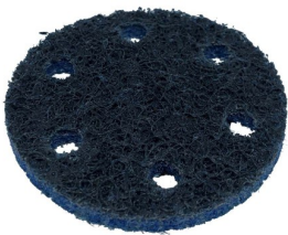
6158135410 NON-WOVEN ONDERLEGGER FIJN 2" TR (50 ST) VOOR RC7601