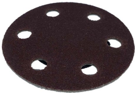
6158135380 HARS GEBONDEN PAD 120 GRIT 2" TR (50 ST) VOOR RC7601