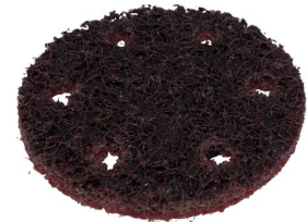
6158135400 NON-WOVEN ONDERLEGGERS MEDIUM 2" TR (50 ST) VOOR RC7601