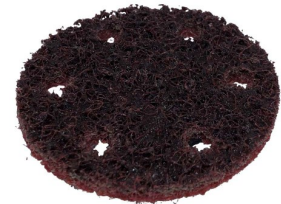
6158135400 NON-WOVEN ONDERLEGGER MEDIUM 2"TR (50ST) VOOR RC7601