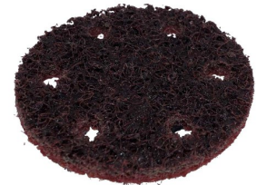
6158135400 NON-WOVEN ONDERLEGGER MEDIUM 2"TR (50ST) VOOR RC7601