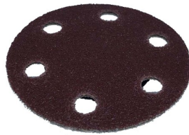
6158135360 HARSGEBONDEN PAD 60 GRIT 2" TR (50 ST) VOOR RC7601