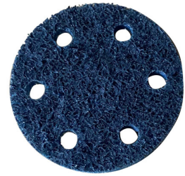
6158135370 HARSGEBONDEN PAD 80 GRIT 2" TR (50ST) VOOR RC7601