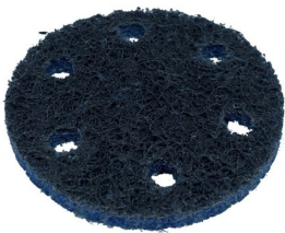
6158135410 NON-WOVEN ONDERLEGGERS FIJN 2" TR (50 ST) VOOR RC7601