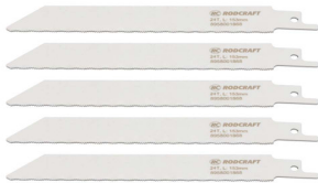
8958001872 SET VAN 5 ZAAGJES VOOR METAAL, HOUT, PLASTIC - LENGTE 152mm - 24 TANDEN