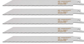
8958001870 SET VAN 5 ZAAGJES VOOR METAAL, HOUT, PLASTIC - LENGTE 152mm - 14 TANDEN