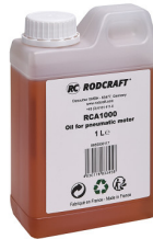
8955000117 RCA1000 OLIE VOOR PNEUMATISCH GEREEDSCHAP