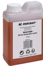
8955000117 RCA1000 OLIE VOOR PNEUMATISCH GEREEDSCHAP