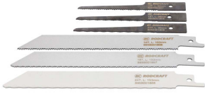
8958001869 SET VAN 6 ZAAGJES VOOR METAAL, HOUT, PLASTIC - HIGH SPEED