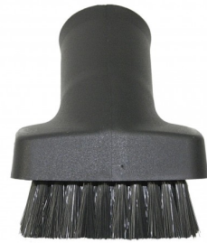
418032 RONDE BORSTEL 8 CM DIA 35 MM STARMIX