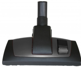
414454 COMBIBORSTEL PROFI 29CM DIA.35MM STARMIX NEW