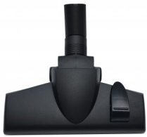
414447 COMBIBORSTEL 25CM DIA 35 MM STARMIX NEW