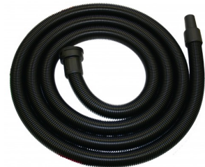
426563 ZUIGSLANG ANTISTATISCH DIA.35 MM 5M STARMIX