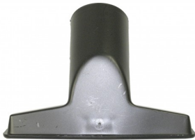
418452 HAakse ZUIGMOND 12CM MET BORSTELSTRIPS DIA.35MM STARMIX