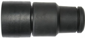
425726 ROTEERBAAR GUMMI KOPPELSTUK 11CM STARMIX