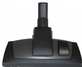
414454 COMBIBORSTEL PROFI 29CM DIA.35MM STARMIX NEW