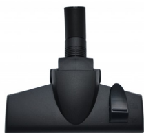
414447 COMBIBORSTEL 25CM DIA 35 MM STARMIX NEW