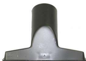
418452 HAakse ZUIGMOND 12CM MET BORSTELSTRIPS DIA.35MM STARMIX