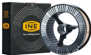
97040 Lasdraad SG 2 spoel 1,0 mm 15kg