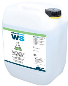
96427 KOELVLOEISTOF 10L