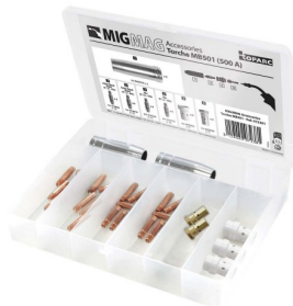
595072381 MIG-toebehorensset MB501