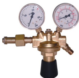
97202 Reduceerventiel met 2 manometers (Nederland)