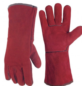
97326 Lashandschoenen (lang) MIG/MAG – elektrode