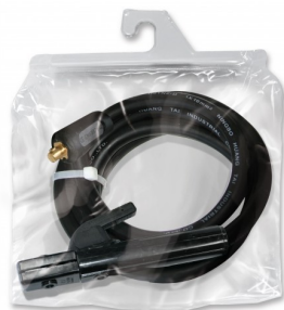
97314 Elektrodekabel gemonteerd T25- 4m-200 A-10/