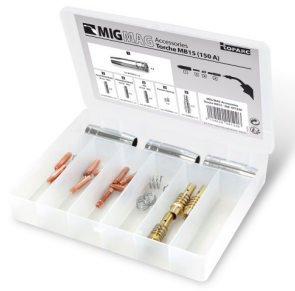
97587 MIG-toebenhorenset 7XM-15