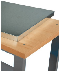
776804 Gegalvaniseerd werkblad 1500 mm (diepte: 800mm)