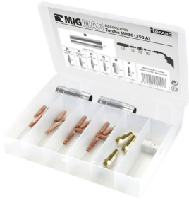
97589 MIG-toebehorenset 7XM-36