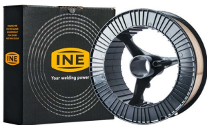
97040 Lasdraad SG 2 spoel 1,0 mm 15kg