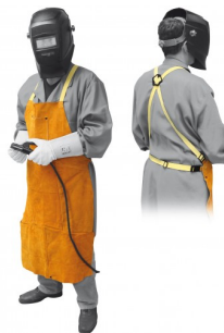
97575 LASSCHORT PROFI