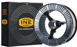
97040 Lasdraad SG 2 spoel 1,0 mm 15kg