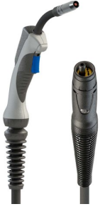
6025030T8 8XM-25 MIG-toorts met EURO-aansluiting 3 m