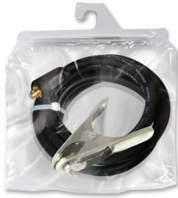
97313 Massakabel gemonteerd T50- 4m-400 A-35mm 2