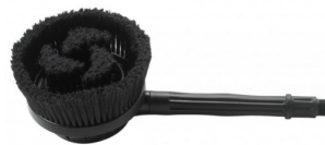
14130029 Draaibare borstel