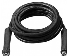
33010985 Verlenging voor hogedrukslang 10m