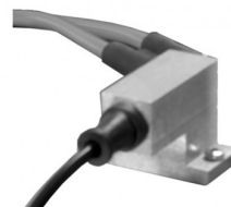
50180114 Flame control unit