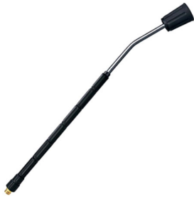
33010787 Lans (excl. sproeikop)