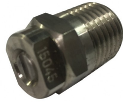
34000703 Standaard sproeier