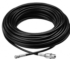
30450036 Rioolrat 25m