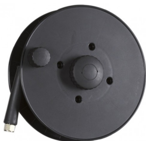
70020382 Hoge drukslang 20m op haspel