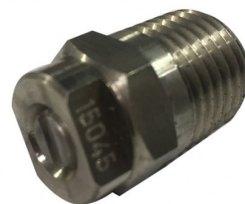
34000746 Standaard sproeier