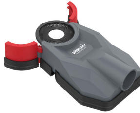
530110134 Bohrfixx 60 Plus