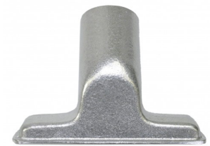
419763 HAAKSE ZUIGMOND ALU 12CM EXCL BORSTELSTRIP STARMIX