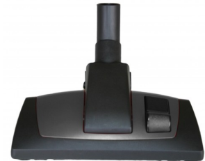
414454 COMBIBORSTEL PROFI 29CM DIA.35MM STARMIX NEW