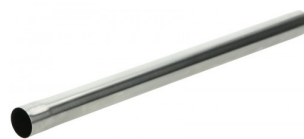
424842 INOX VERLENGBUIS 50CM (PER STUK) STARMIX