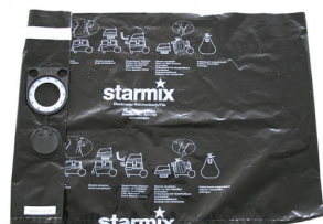
425764 PE-opvangzak klasse M-H (per 5)