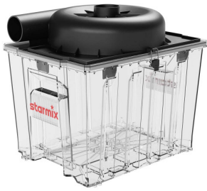
530130217 Dustfixx 25 AS