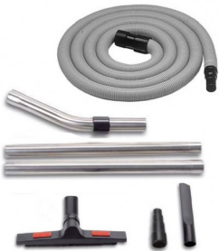
530072401 COMPLETE SET EWS STARMIX