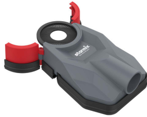
530110134 Bohrfixx 60 Plus