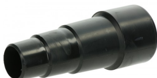
425719 MULTI-ADAPTER (25,5-38MM) DIA.35MM STARMIX