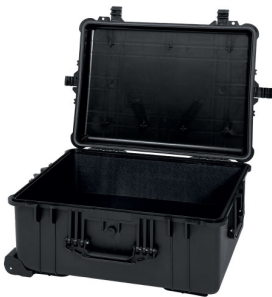
595077461 TROLLEY OP WIELEN - IP67