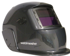
99964 Lashelm automatisch Weldmeister BASIC TRUE COLOR