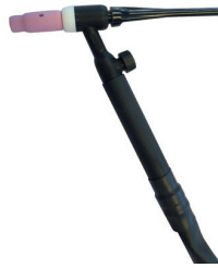
6037050 TIG TOORTS SR 26 V - T50 - 4M - MANUEEL GASKRAAN