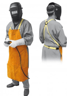
97575 LASSCHORT PROFI