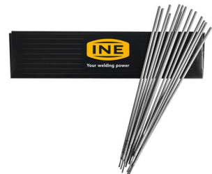
97160 Laselektroden RUTILE (staal) 3,25mm per 2,5kg (88 stuks)