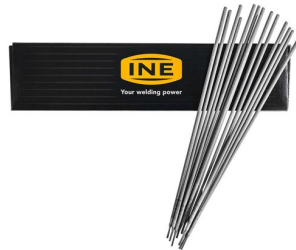
97160 Laselektroden RUTILE (staal) 3,25mm per 2,5kg (88 stuks)