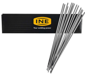
97165 Laselektroden RUTILE (staal) 4,0mm per 2,5kg (60 stuks)