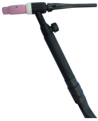
500028T TIG-toorts SR 17V -T25 - 4 M - manuele gaskraan