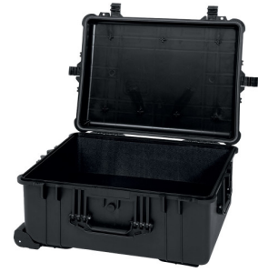
595077461 TROLLEY OP WIELEN - IP67