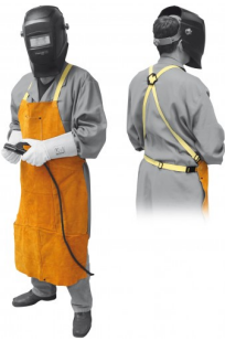
97575 LASSCHORT PROFI