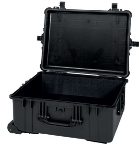
595077461 TROLLEY OP WIELEN - IP67