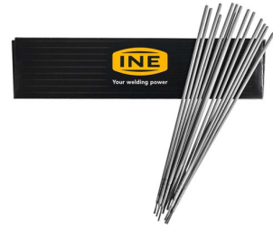
97155 Laselektroden RUTILE (staal) 2,5mm per 2,5kg (135 stuks)