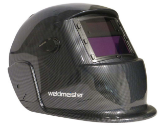
99964 Lashelm automatisch Weldmeister BASIC