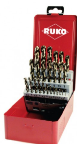
40678 Set spiraalboren DIN 338 type N HSS-G Co5 (25-delig)