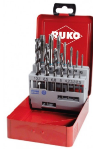
40670 Machinetappenset HSS