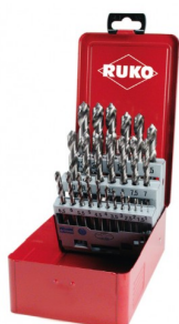
40677 Set spiraalboren DIN 338 type N HSS-G (25-delig)