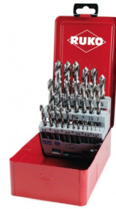
40677 Set spiraalboren DIN 338 type N HSS-G (25-delig)