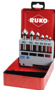
40664 Set verzinkboren C 90° DIN 335 HSS