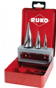
40663 Trappenboorset HSS Co5