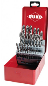
40677 Set spiraalboren DIN 338 type N HSS-G (25-delig)