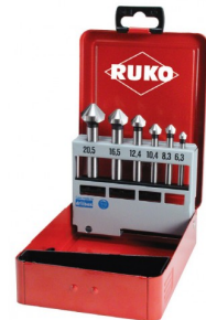
40664 Set verzinkboren C 90° DIN 335 HSS