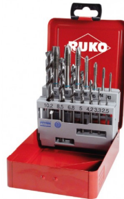
40670 Machinetappenset HSS