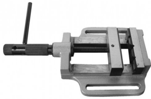
45032 Spanklem met prismabekken 150 mm