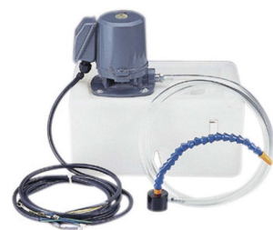
40130 Universele koelpomp 230V