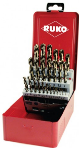
40678 Set spiraalboren DIN 338 type N HSS-G Co5 (25-delig)