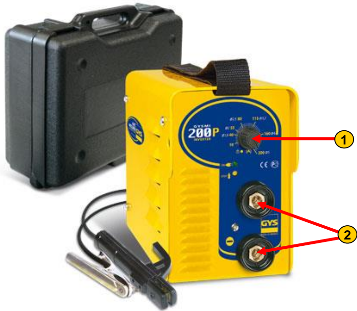
Ancienne génération Old version