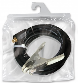
97313 Massakabel gemonteerd T50- 4m-400 A-35mm 2