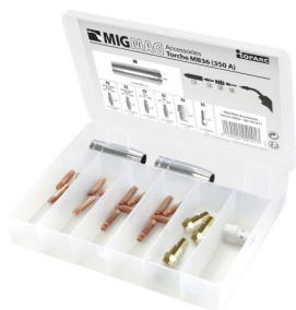
97589 MIG-toebehorenset 8XM-36