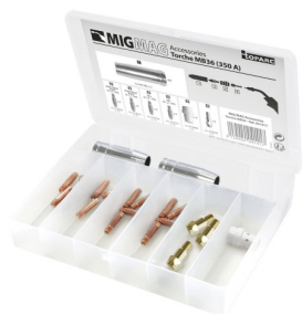
97589 MIG-toebehorenset 8XM-36