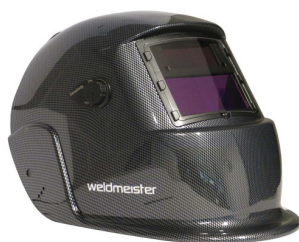
99970 Lashelm automatisch Weldmeister XL TRUE COLOR