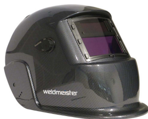
99970 Lashelm automatisch Weldmeister XL TRUE COLOR