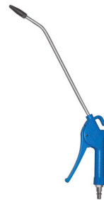
28744 Doseerbaar blaaspistool met lange bek 500mm