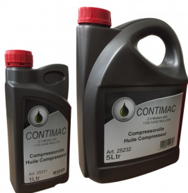
25231 Olie voor zuigercompressoren