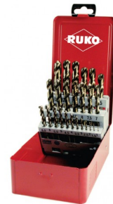
40678 Set spiraalboren DIN 338 type N HSS-G Co5 (25-delig)