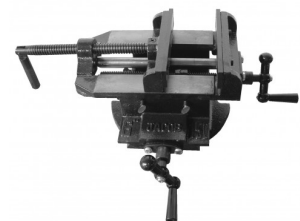
45042 Met kruistafel 125 mm