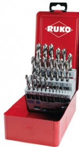
40677 Set spiraalboren DIN 338 type N HSS-G (25-delig)