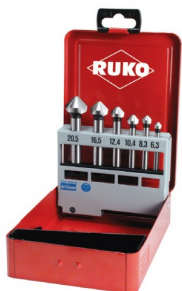
40664 Set verzinkboren C 90° DIN 335 HSS