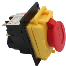
19080 SCHAKELAAR DSM 150-175-200