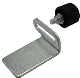
99823 BEITELSTEUN RECHTS DSM 150-175