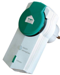
407004353 VARMA SCHUKO AANSLUITING MET AFSTANDSBEDIENING TEC 206/F1