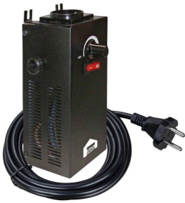
407004314 VARMA TEC STAR 4 VERMOGENSREGELAAR TOT 3000 W