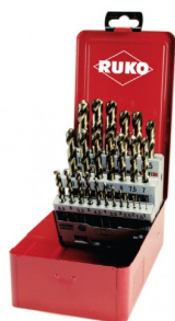
40678 Jeux de forets DIN 338 type N HSS-G Co5 (25 pièces)