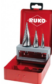
40663 Jeux de fraises étagées HSS Co5