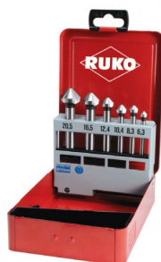
40664 Jeux de fraises à chanfreiner C 90° DIN 335 HSS