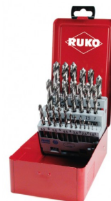
40677 Jeux de forets DIN 338 type N HSS-G (25 pièces)