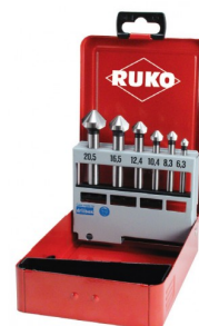
40664 Jeux de fraises à chanfreiner C 90° DIN 335 HSS