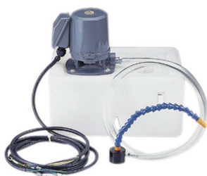
40130 Pompe de refroidissement universel 230V