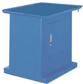
40100 Socle pour RF 30-40-45