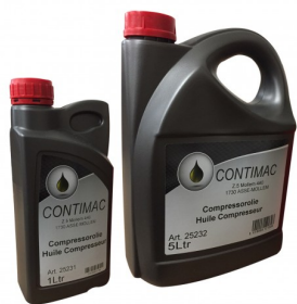
25231 Huile pour compresseurs