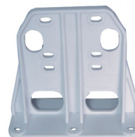
6011520 Console de fixation au mur PVC