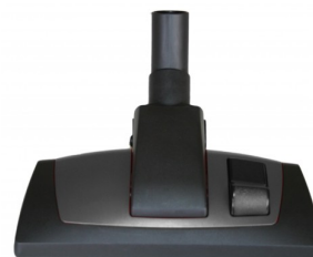
414454 BROSSE COMBINEE PROFI 29 CM DIA.35MM STARMIX