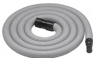
413228 TUYAU D'ASPIRATION COMPLET 3,5M DIA.35MM