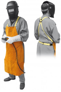
97575 TABLIER DE SOUDAGE PROFI