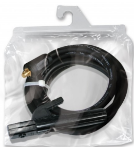
97314 CABLE PORTE ELECTR. MONTE T25- 4m-200 A-10/