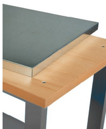
776804 Plateau galvanisé (profondeur: 800mm)