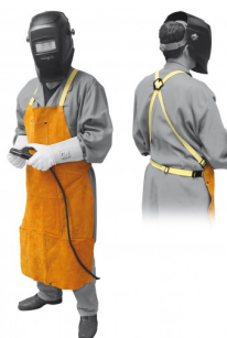
97575 TABLIER DE SOUDAGE PROFI