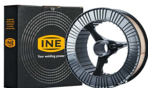
97040 Fil de soudure SG 2 bobine 1,0 mm 15kg