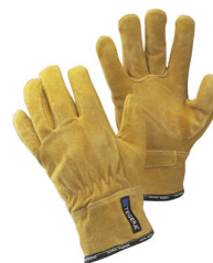
97322 Gants de soudage (court) MIG/MAG - électrode