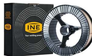
97040 Fil de soudure SG 2 bobine 1,0 mm 15kg