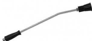
33011587 Lance (sans gicleur)