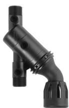
0608004900 Système anti-retour