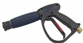
24100227 Poignée-pistolet swivel