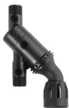
0608004900 Système anti-retour