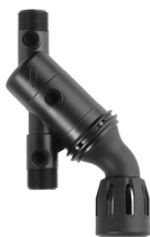
0608004900 Système anti-retour