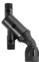
0608004900 Système anti-retour