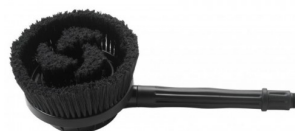
14130029 Brosse pivotante