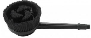
14130029 Brosse pivotante