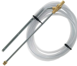
33010772 Kit sablage