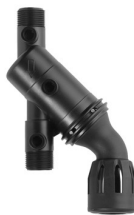
0608004900 Système anti-retour