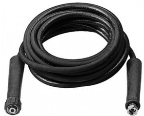
33010985 Rallonge pour tuyau haute pression 10m